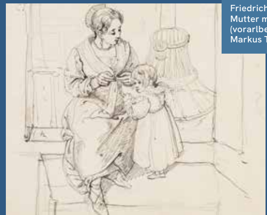
Friedrich Mosbrugger: Mutter mit Kind.