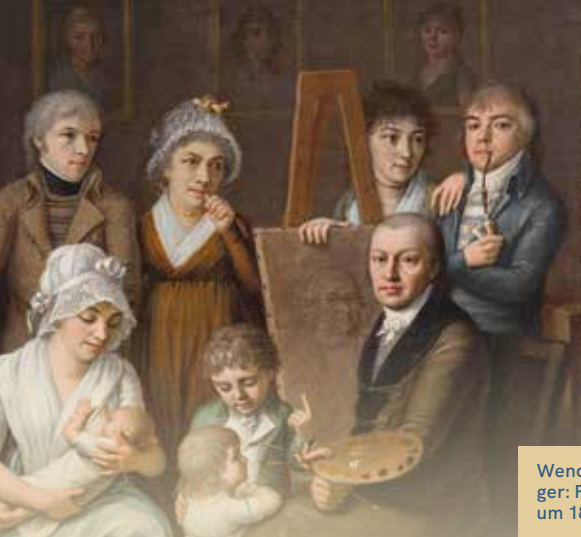
Wendelin Mosbrugger: Familienbild, um 1802/03.

Die aus Vorarlberg stammende Künstlerfamilie Mosbrugger ist von 1795 bis zum Tod des letzten Malers, Joseph, 1869 am Bodensee, in den angrenzenden Landschaften und im Schweizer Umland tätig. Ihr Werk umfasst eindrucksvolle, tief psychologisch gestaltete Porträts, repräsentative Familienbilder, geistliche Motive, Landschaftsmalerei und Genredarstellungen. Ihre Zeit ist geprägt von kriegerischen Unruhen, Hungersnöten, politischem, wirtschaftlichem und kulturellem Aufbruch, von der Revolution 1848/49 und von der langen Phase der Reaktion mit ersten Aufbrüchen in die moderne Welt bis fast zur Reichsgründung von 1871.