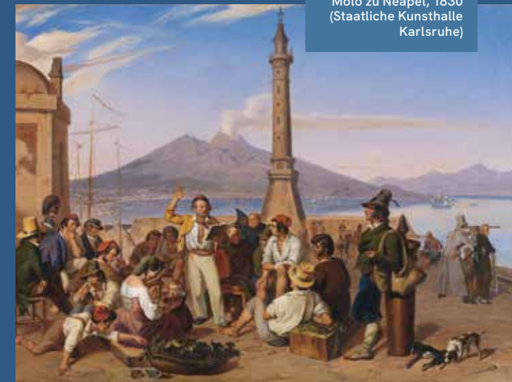
Friedrich Mosbrugger: Der Improvisator am Molo zu Neapel, 1830 (Staatliche Kunsthalle Karlsruhe)

Sonntag, 27. September um 11 Uhr Freitag, 16. Oktober um 16 Uhr Samstag, 14. November um 14.30 Uhr Konzertführung in der Ausstellung „Die Mosbruggers“ in Kooperation mit Bodensee-Philharmonie Führung inkl. Konzert Kosten: 30 €/Person, 15 €/SchülerInnen und StudentInnen Anmeldung unter: ines.stadie@konstanz.de oder +49 (0)7531 / 900-2914