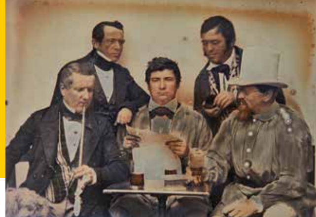
Fünf zeitunglesende Revolutionäre aus Waldkirch: Seltene fotografische Darstellung, die Teilnehmer der Aufstände des Jahres 1848 teils in „Heckerblusen“ zeigt.

Fr, 1. Dezember um 19 Uhr FLÜSSIGE GEHEIMNISSE NORDAMERIKAS – WHISKY-TASTING Ein unterhaltsamer und genussvoller Abend mit dem Whiskybotschafter Ulrich Büttner Museumscafé des Rosgartenmuseums, Kosten: 35 Euro Anmeldung: rosgartenmuseum@konstanz.de