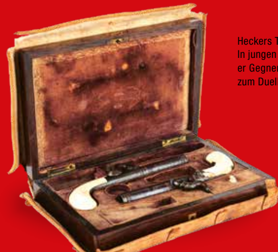
Heckers Taschenpistolen. In jungen Jahren hätte er Gegner immer wieder zum Duell gefordert.

Sonderausstellung des Rosgartenmuseums im Kulturzentrum am Münster